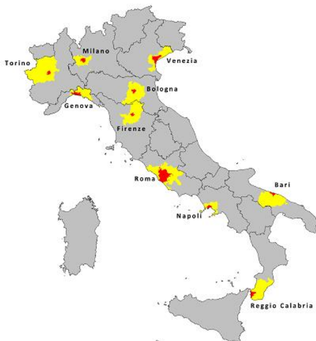
Figura 1 Le 10 città metropolitane nelle regioni a statuto ordinario, 2014